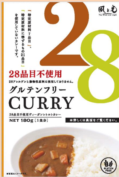
レトルトカレー 1食分

どなたでも安心してお召し上がりいただけるカレーです。 28品目のアレルギー特定原材料と9つの主要スパイスが入っていないのに、 驚きのおいしさ！レトルトタイプとルータイプ、どちらも好評発売中。 小さなお子様からお年寄りまで幅広く支持されています。