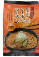
うまチゲラーメン 味噌と豆板醤のkokと辛みに チキンエキスの旨みを加えた 濃厚な味の競演