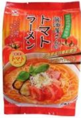
トマトラーメン 2食入