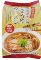
しょうゆラーメン 国産丸大豆・国産小麦が原料の 天然醸造丸大豆醤油を使用