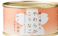
小女子(一味唐辛子)

原材料に使用される醤油は 地元産高砂長寿味噌本舗の 醤油と、砂糖には弊社が納 入しているミネラル豊富な 喜界島産の粗糖を使用して おります。