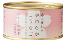
小女子佃煮(白胡麻)

鮮度の良い状態で生から佃煮にする(生炊き) ため味染みもよく、旨みや栄養分を逃がさず にふっくらと柔らかく仕上げました。 毎年春、石巻・女川漁港で水揚げされる新鮮な 小女子(こうなご)を使用。魚臭さも感じません ので、お子様にもオススメです。