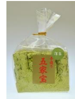
抹茶五家宝 (8本巾着)