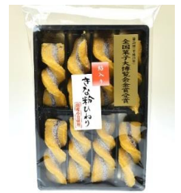
下町餡入 きな粉ひねり (8本)