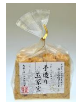
五家宝きなこ (8本巾着)