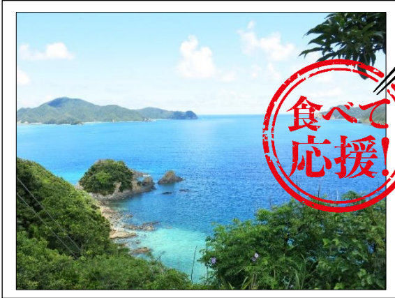
奄美大島・マネン崎からの眺め