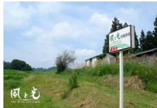
川西町にある弊社実験農場

弊社の実験農場のある山形県川西町には、地元のおばあちゃんたちが昔から大切に受け継いできた「紅大豆」という在来種があります。川西町は四季の変化がはっきりしている「盆地性気候」で、紅大豆の生産に適しています。もともとは「赤豆の煮物」の食文化が伝承されてきましたが、山形名産の「紅花」にちなんで、「紅大豆（べにだいず）」と命名されました。ポリフェノールや食物繊維が豊かです。