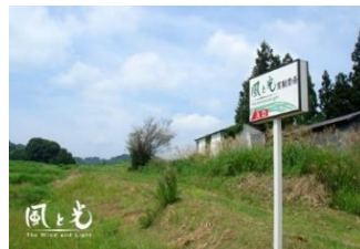
川西町にある弊社実験農場

弊社の実験農場のある山形県川西町には、地元のおばあちゃんたちが昔から大切に受け継いできた「紅大豆」という在来種があります。もともとは「赤豆の煮物」の食文化が伝承されてきましたが、山形名産の「紅花」にちなんで、「紅大豆（べにだいず）」と命名されました。ポリフェノールや食物繊維が豊富です。