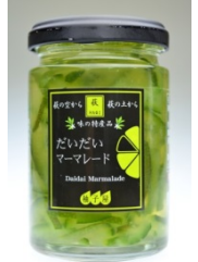
だいだい マーマレード