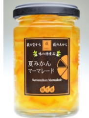
夏みかん マーマレード

一枚づつ手作業でスライスし、着色料を一切使用せずに自然の素材の色を残ししっかりとシロップを含んだ皮に仕上げました。