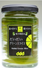
だいだい グリーン スライス