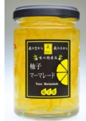
柚子 マーマレード