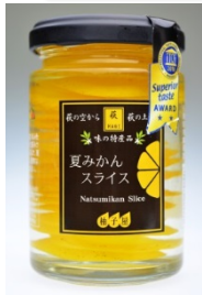
夏みかんスライス