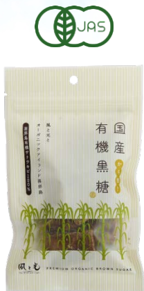
国産有機黒糖 かち割り100g 24入 550円