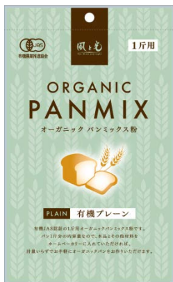
オーガニック パンミックス粉 プレーン 270g (1斤用)

キューブタイプのパンミックス粉の終売に伴い袋タイプのパンミックス粉（1斤用）を発売します