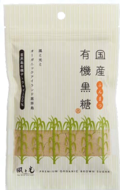
国産有機黒糖 粉末 100g 24入 550円