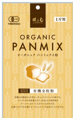
オーガニック パンミックス粉 全粒粉 250g (1斤用)